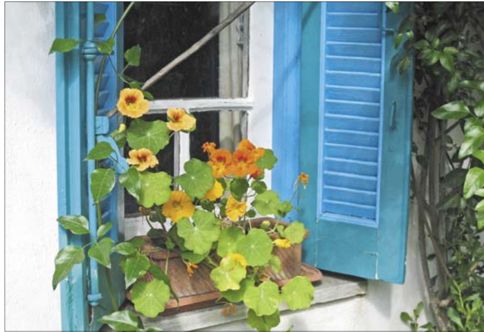
Fenster in den Garten der Natur