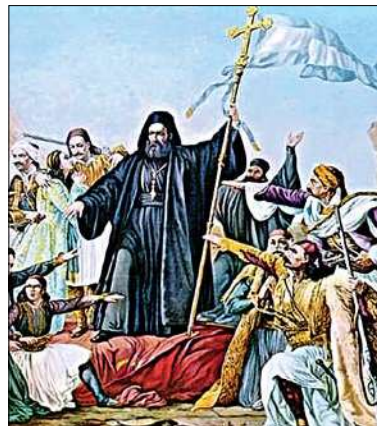
Szene vom Aufstandsbeginn

in einer zwischen Pathos und Poesie changierenden Sprache eine Geschichte aus den Anfangstagen der Griechischen Revolution, als die Griechen mit dem legendären Theodoros Kolokotronis an der Spitze Tripolis belagern und kurze Zeit später einnehmen (und die muslimische Bevölkerung massakrieren). Sein Roman, Auftakt einer Trilogie um die zentrale Figur Michalos Russis, passt freilich nicht so recht in das offizielle Narrativ des heldenhaften Aufstandes, das besonders auch in diesem Jahr, dem 200. seit dem Beginn der Revolution, in Griechenland bemüht wird. Gewiss war der elfjährige Freiheitskampf der Griechen gegen ein übermächtig erscheinendes, in sich allerdings bereits marodes Osmanisches Reich ein bewunderungswürdiger historischer Kraftakt gewesen, aber die Aufständischen waren zerstritten und verfolgten zum Teil eigene Ziele, wie etwa die Kotzambassides. So vermag sich auch der selbstgefällige Michalos im Roman nicht zwischen eigenen und griechischen Interessen zu entscheiden. In seinem hochinformativen und für das Verständnis dieses Romans eminent wichtigen Nachwort beschreibt der griechisch-deutsche Historiker Ioannis Zelepos die Bedeutung der Kotzambassides für das Osmanische Reich und den Aufstand der Griechen, sind sie letzten Endes doch sowohl als „Ausbeuter des Volkes“ als auch als „Freiheitskämpfer“ in die Geschichtsbücher eingegangen.