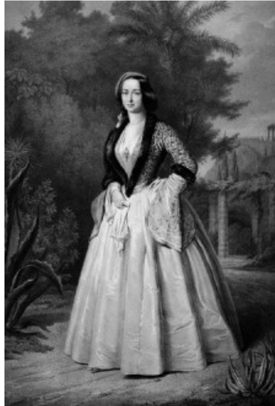
Abb. 13 und Abb. 14: Otto und Amalie tragen eine „griechische“ Tracht. In dieser Kleidung will das fremde Königspaar seine Verbundenheit mit Griechenland aufzeigen. Die Königin hat die neue Amalientracht selber entworfenen. (Litho F. Hanfstaengel, 1853/54)

rée: Ein weißes Tüllkleid und gleiche Tunika, beide mit Garnierungen von Federn; eine einzige Feder auf dem Kopf, malerisch von da auf Hals und Brust herunterspielend – über die Stirn eine Reihe Diamanten, die Feder auch von einem Juwelenbouquet gehalten, ebenfalls auf den Schultern Diamantagraffen und mit solchen auch das Korsett bis auf den Gürtel hinab geschmückt.“